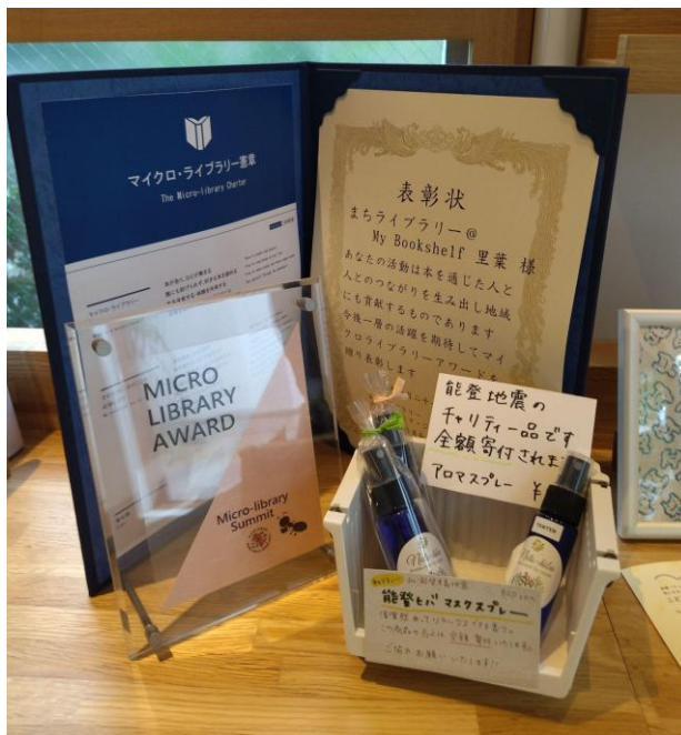
人と人のつながりを生み出す場所として表彰されている。

— 当初は「孤独の解消」という目的だった里葉さんが、今後「自己表現の場」として、次のフェーズに移行していくのですね。本日はお時間をいただきありがとうございました。今後のイベントの開催を楽しみにしています。