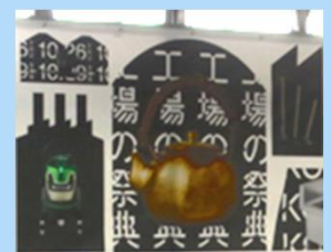
オープンファクトリ集合写真 工場の祭典ポスター