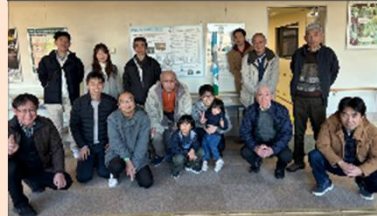
施設見学会 令和5年は 世田谷清掃工場の見学