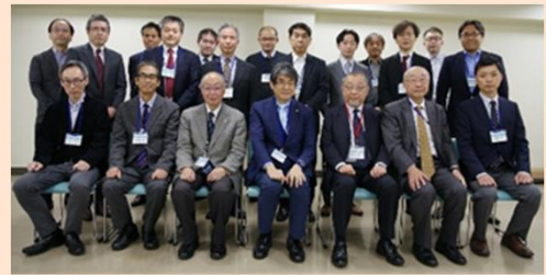
JOPY19期修了式集合写真