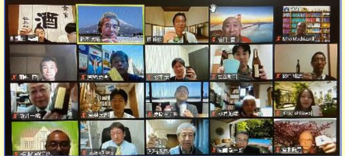
ZOOM・Clubhouse利用のオンライン・オープンセミナー：震災以降交流している福島県郡山市・有名老舗酒造の杜氏・女将を講師にお招きして

企業内診断士とプロコンによる異業種交流会の一面もあり、ネットワークが広がります。 (コロナ禍で自粛中ですが) 例会後の懇親会では各会員企業の業界裏話も聞くことができたりと、貴重な情報交換の場になっています。