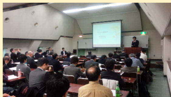
[過去の研究成果発表会の様子]