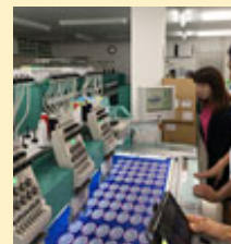
(フィールドワーク)