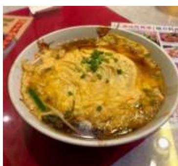
神田 四川厨房随苑