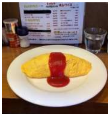
神田 美味卵家 オムライス 鶏だしケチャップライス