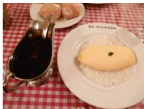
調布 クリスマス亭 チーズオムハヤシライス (チーズオムレツ+ご飯) ×デミグラスソース