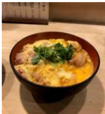
神田 伊勢ろく本店 親子丼 とろとろ半生たまご

この「パンヤの食堂」の、トマトソースで調味した炒飯を薄焼き卵で包む「オム、ライス(たまごと肉の飯)」が街の洋食店に広まり、家庭でも調理されるようになっていきます。しかし、フランス人に言わせると、オムレツにケチャップをかけるのはアメリカ人と日本人だけだそうです。現代のオムライスには、トマトケチャップだけでなく、ミートソースやデミグラスソース、果ては明太子ソースまで様々なバリエーションが出てきています。