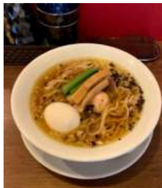
神田 金魚ヌードル