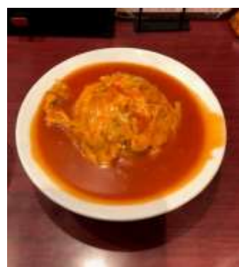
神田 天津飯店 天津丼 関東風ケチャップ中華あん