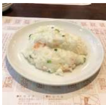
老辺餃子館 新宿本店

天津から輸入された安くて美味しいたまごで調理した芙蓉蟹をのせた麺を“天津麺”と名付け、新興のオシャレな中華料理店である「銀座アスター」や「海曄軒」で売り出すことで、天津卵をブランド化する戦略です。