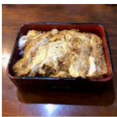
神田 かつ進 かつ重 洋食カツレツ×和食玉子とじ