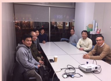
L E C会議室での様子

企業内診断士を中心にして、いろいろな業界の動向にふれることができます。企業内診断士の人脈を作りたい方、診断士としての活動をどうやって始めようかと悩んでいる方など、お気軽にご参加ください。