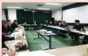
診断結果報告会の模様

計画などの内部資料を開示していただき、全員で改善策を検討します。「全員が提案し、人の良いところは自分のものにする。質問・反論はOKで批判はしない」のが原則です。情報を共有し、切磋琢磨することでコンサルの経験とノウハウを得ることが出来ます。 現在は、人事評価制度構築や中期経営計画策定の支援、及び（当会が提案・主導した）社員意識調査のフォローアップなどに取り組んでいます。もちろん、実務ポイントも取得できます。