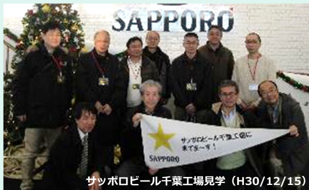
サッポロビール千歳工場見学 (H30/12/15)

企業内診断士とプロコンによる異業種交流会の一面もあり、ネットワークが広がります。例会後の懇親会では各会員企業の業界裏話も聞けたり、貴重な情報交換の場になっています。