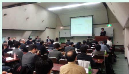
過去の研究成果発表会の様子