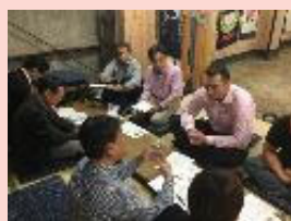
鳴戸部屋コンサル風景

見える化研究の成果を活かし検証することで、各自のコンサル技術の向上を図ります。企業診断ニュース、SMECAニュースにも積極的に投稿し執筆力を磨きます。