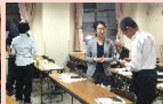
他己紹介のための名刺交換