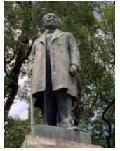
銅像の渋沢栄一氏にも会える！